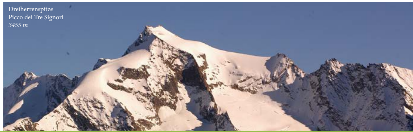
Dreierherrenspitze Picco dei Tre Signori 3455 m